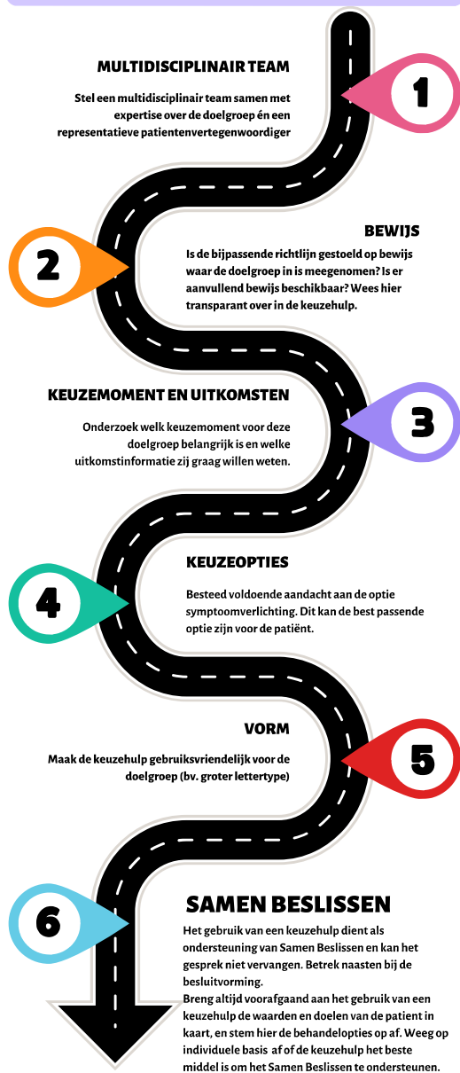
Figuur 1. Kernpunten uit de handreiking