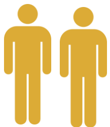
Ad hoc Visitatiecommissie