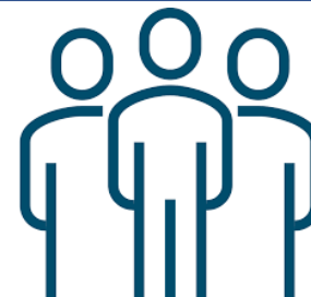
Vertegenwoordiging ziekenhuis C