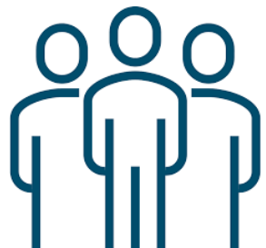
Vertegenwoordiging ziekenhuis A